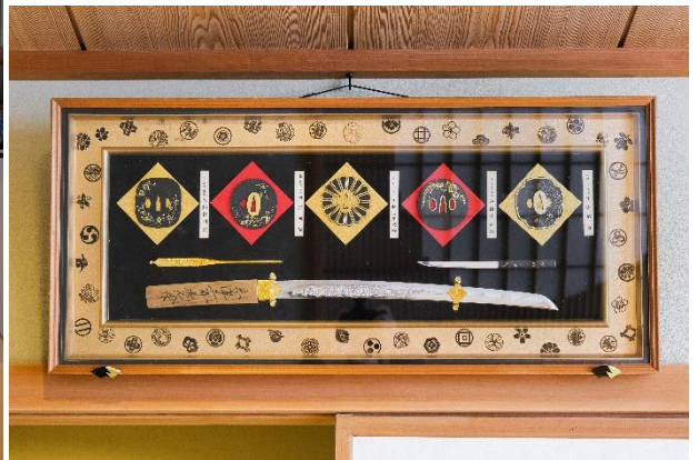
将軍ルーム 将軍房