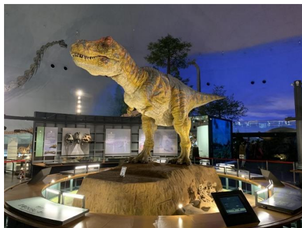
福井県立恐竜博物館 福井縣立恐龍博物館