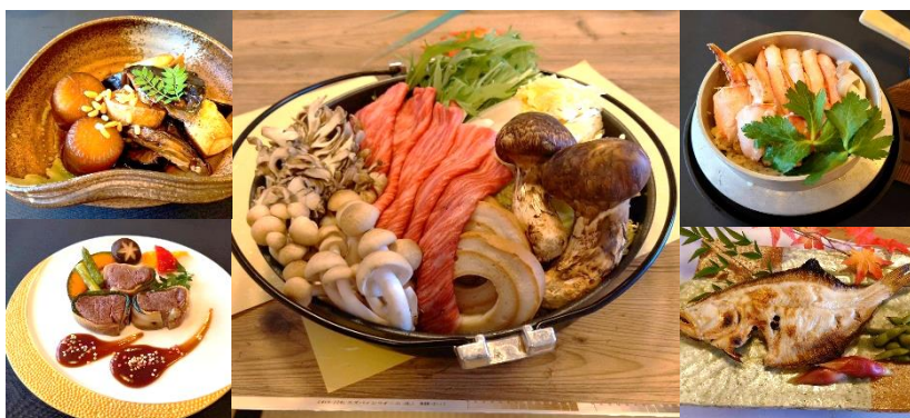
料理のイメージ 料理的形象 (晚餐)