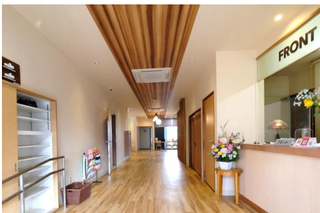
エントランス 入口

- **膳食計劃**：自助餐廳提供當地特色菜餚的菜餚。請盡情享用使用四季食材製作的豐盛晚餐和早餐。