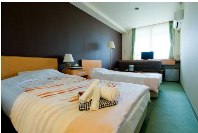
ツインルーム 洋室