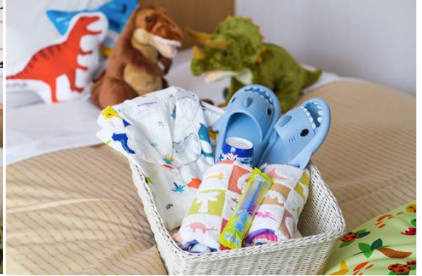
恐竜ルーム 恐龍房