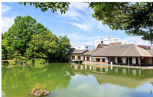
養浩館庭園 养浩馆庭园